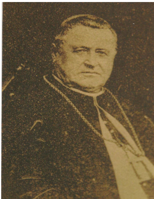
Imagem 1 – Monseñor Giovanni Cagliero: primer Delegado Apostólico con encargos diplomáticos para las repúblicas de: Costa Rica, Nicaragua y Honduras entre 1908 y 1915.