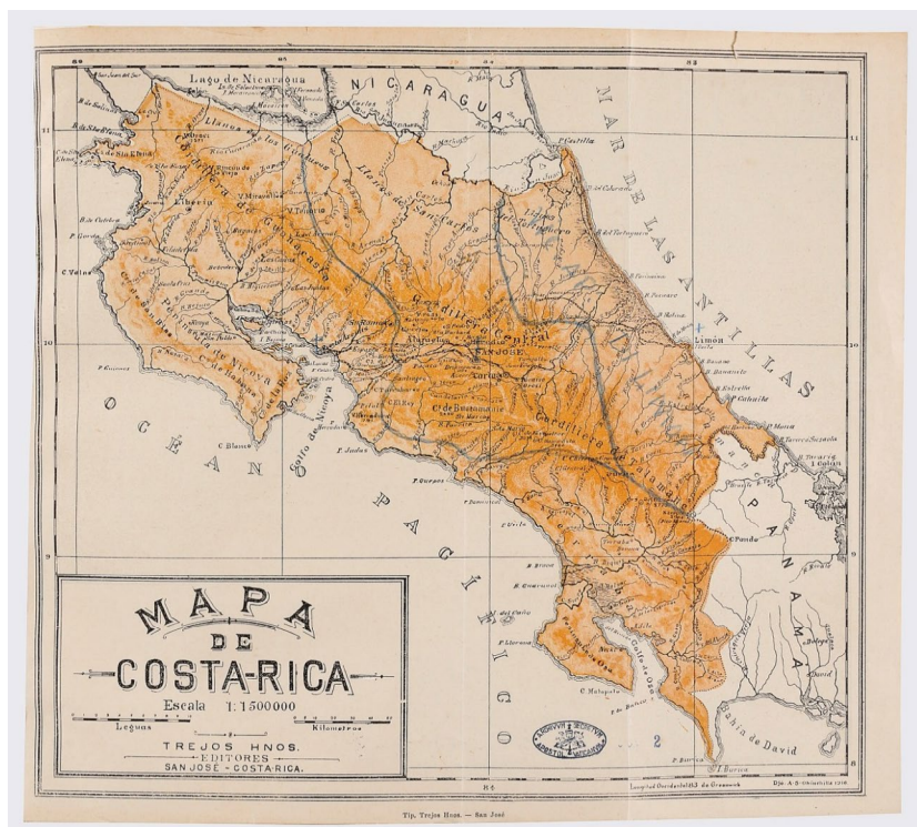
Imagen 3 – Mapa enviado por la internunciatura de Costa Rica al gobierno civil y a la Santa Sede para mostrar la división geográfica de la nueva Provincia Eclesiástica (1920).