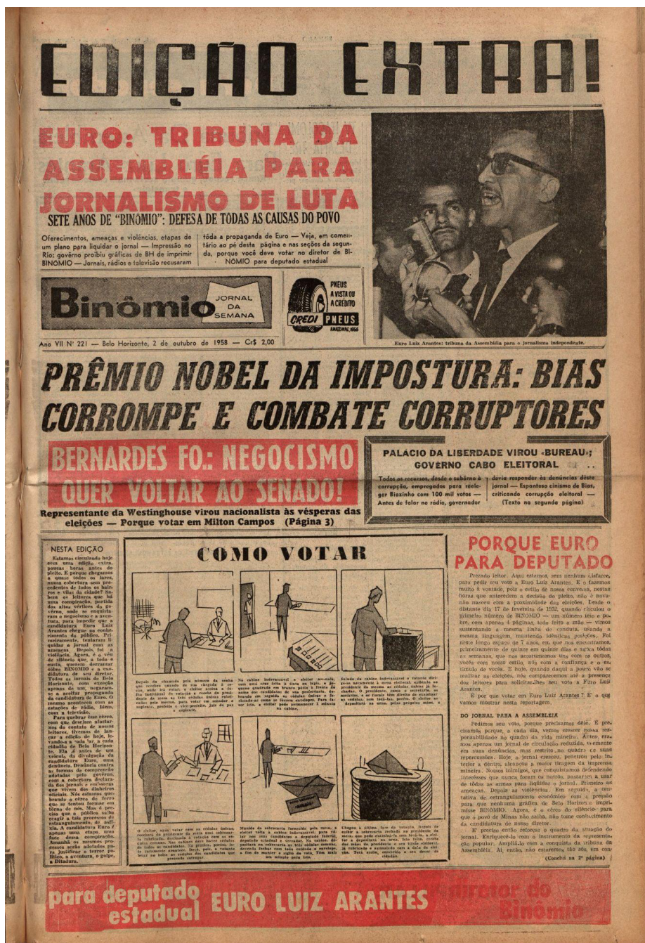
IMAGEM 1. Capa da edição nº 221 do Binômio (1958)