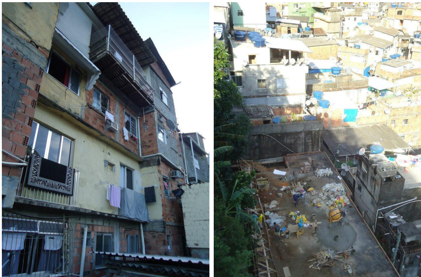
FIGURA 1. Vista e construção de laje em favela no Rio de Janeiro, 2013.