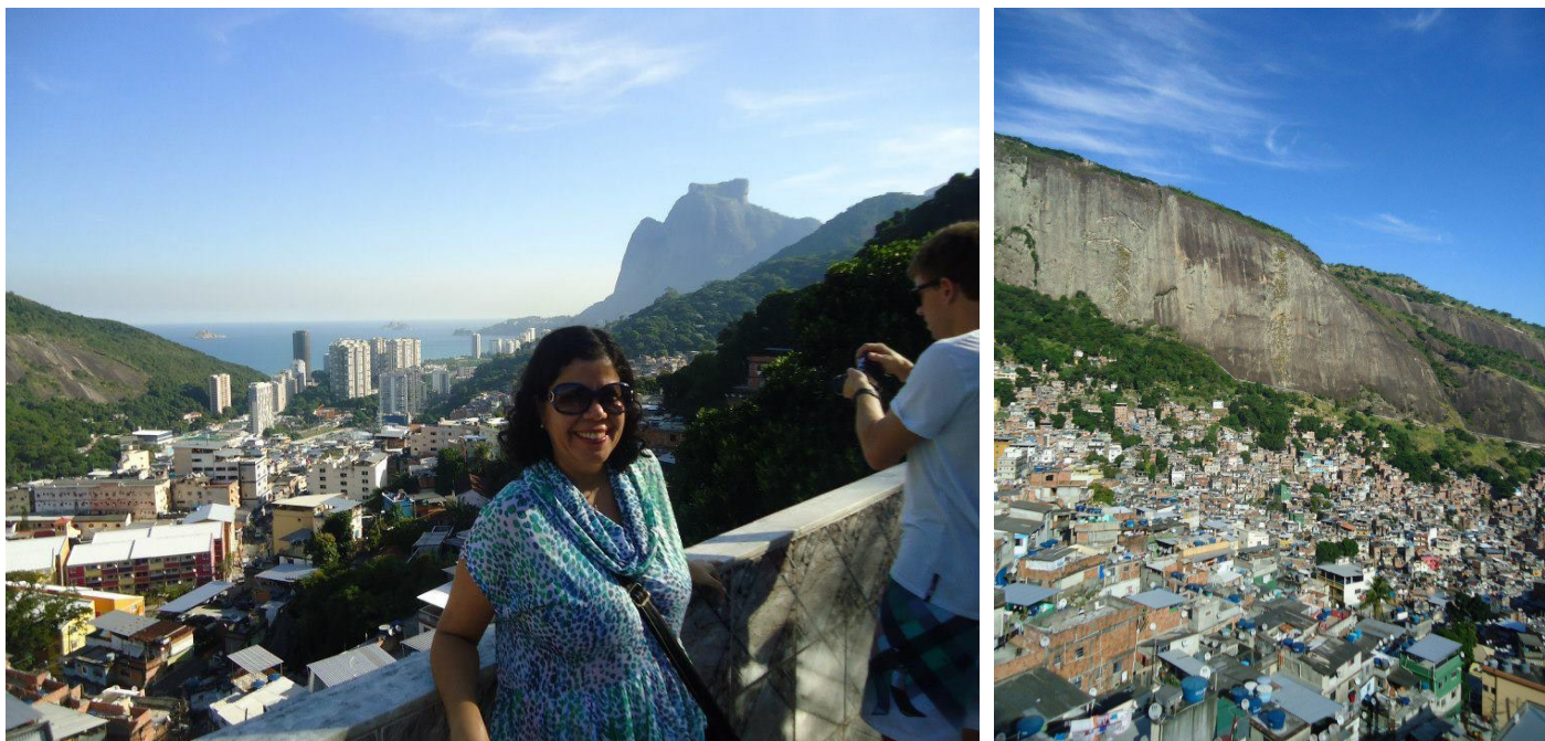
FIGURA 2. Vista da laje de casa onde acontecem festas turísticas em favela do Rio de Janeiro, 2013