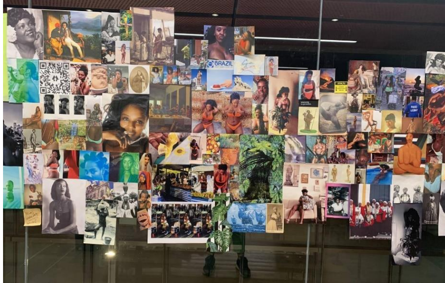
Figura 1 – Mural que precede a obra “Vênus” de Val Souza

No decorrer do estudo sobre “Vênus”, tendo como suporte a metodologia da Análise Documental e Crítica, a proposta de Val Souza se alinha ao tempo que vivemos.