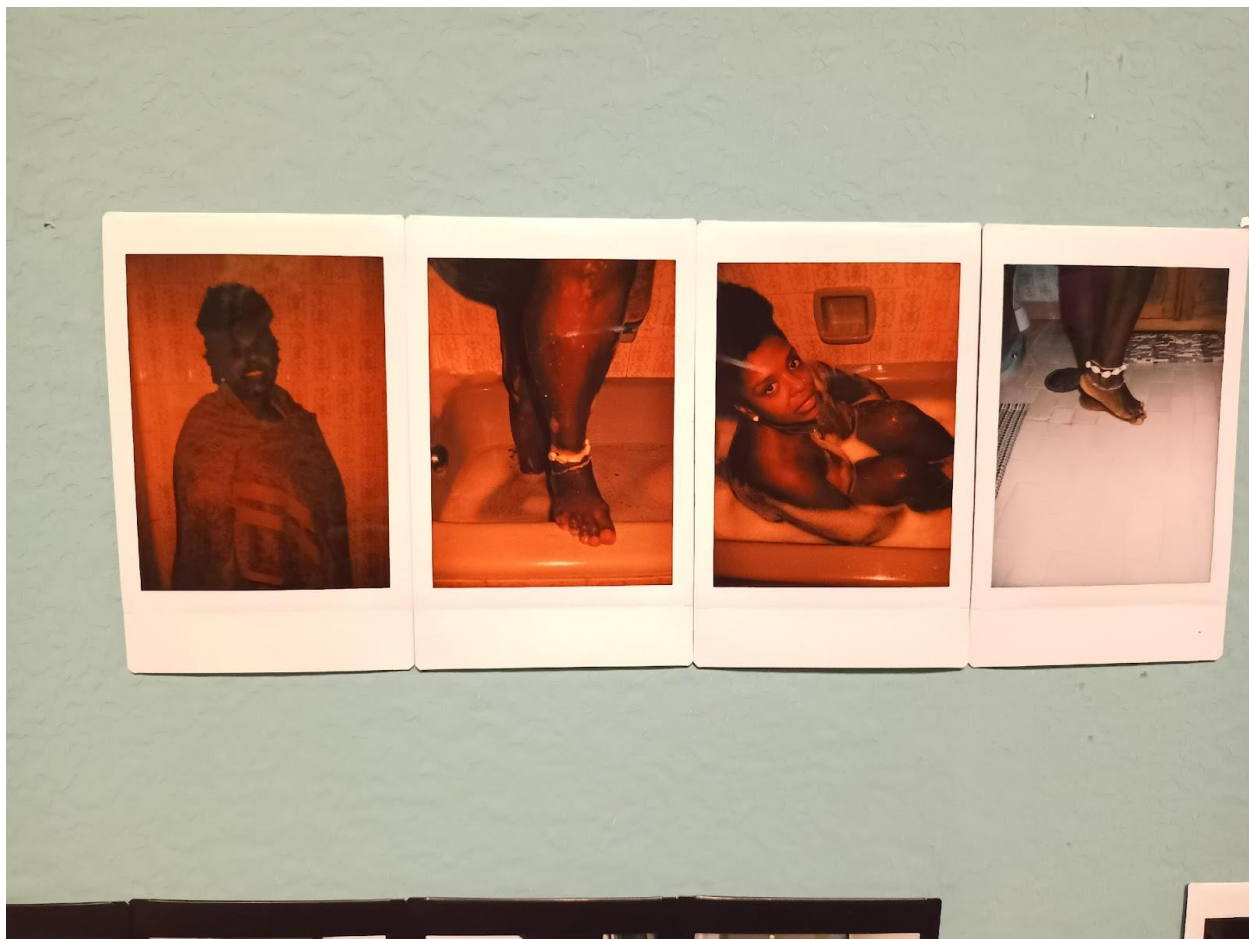
Figura 2 - Fragmento de Vênus assemblage ou Estudos de Vênus 1