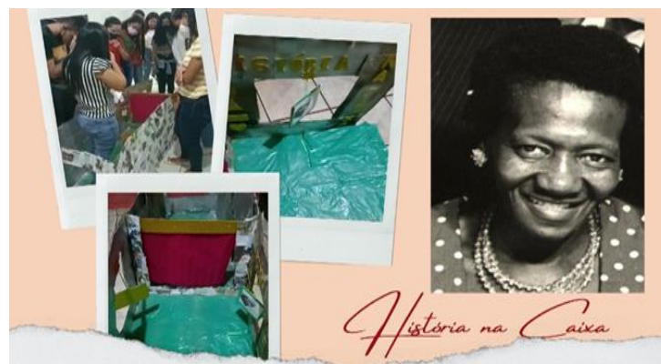
Figura 1: Túnel para representar a o barraco de Carolina Maria de Jesus.

Assim, busca direcionar os resultados obtidos pelos momentos anteriormente realizados em sala de aula, um modelo de proposta será apresentado aos discentes que irá constituir-se através da criação de representações visuais dos textos trabalhados mediada pela didática da história em quadrinhos. No quarto e último momento, será levantado em sala a abertura da promoção de uma discussão dos resultados obtidos com os discentes onde irão poder colocar todas as suas aprendizagens alcançadas através da obra destinando ainda uma oportunidade de os mesmos