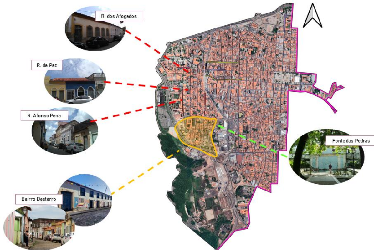
Figura 1 - Mapa de áreas de moradias alugadas.

A maior concentração de moradias era no atual bairro Desterro, uma região mais afastada dos casarões opulentos de famílias abastadas e a justificativa disto ter ocorrido foi a própria segregação espacial e o planejamento urbano como um instrumento de exclusão. As moradias alugadas por escravizadas e libertas eram pagas através dos ofícios de vendas de doces e frutas. As habitações eram simples, multifamiliares, sendo moradia para várias pessoas, escravizadas e libertas, o que expõe um sentimento de cumplicidade e parceria em busca de condições melhores de vida. O habitar coletivo pode ser considerado uma forma de