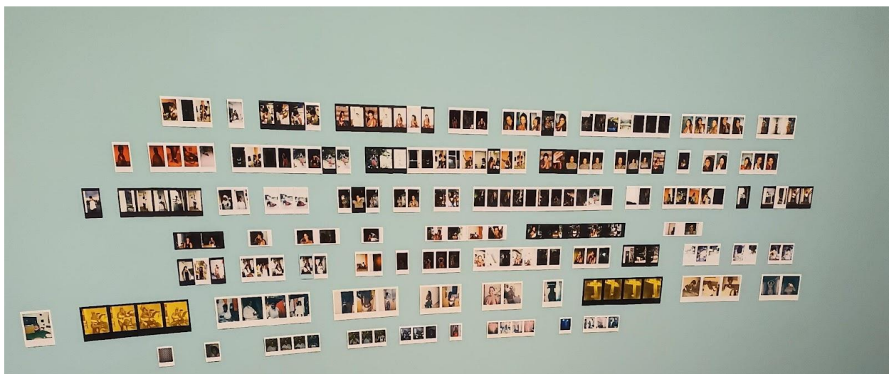
Figura 3 - Vênus assemblage ou Estudos de Vênus 1, foto realizada em visita a exposição: Por muito tempo acreditei ter sonhado que era livre – Programa Arte Atual, no Instituto Tomie Ohtake, 2022.