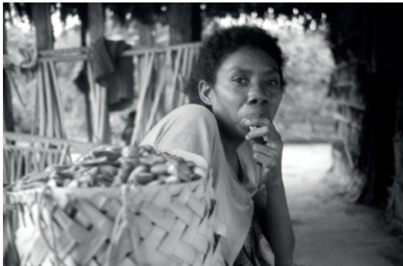
Moradora do Centro. Irmã de Simão