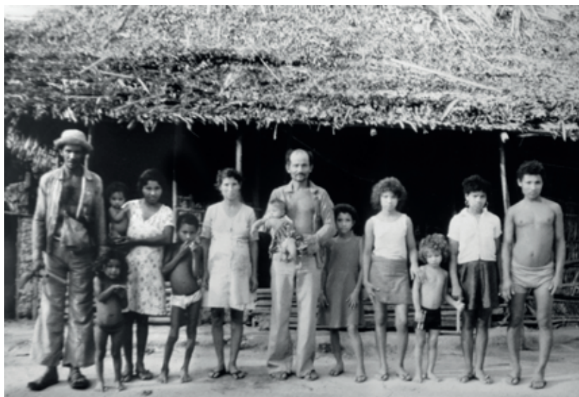
Famílias de Bala e de Simão