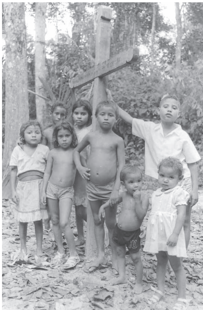
Túmulo de Domingos Bala