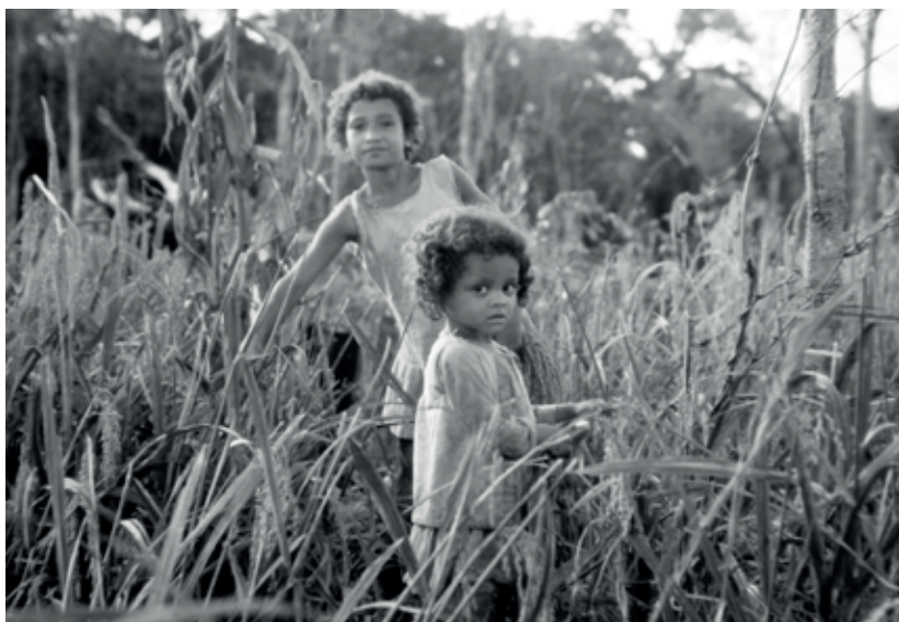
Colheita de arroz no centro