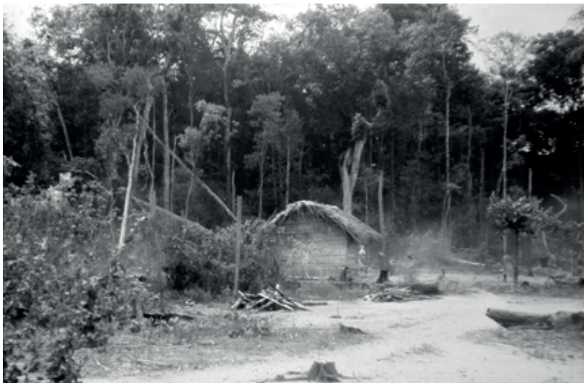
Vista de uma moradia no interior da floresta