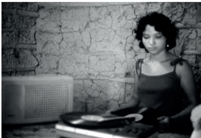
Radiola trazida do garimpo