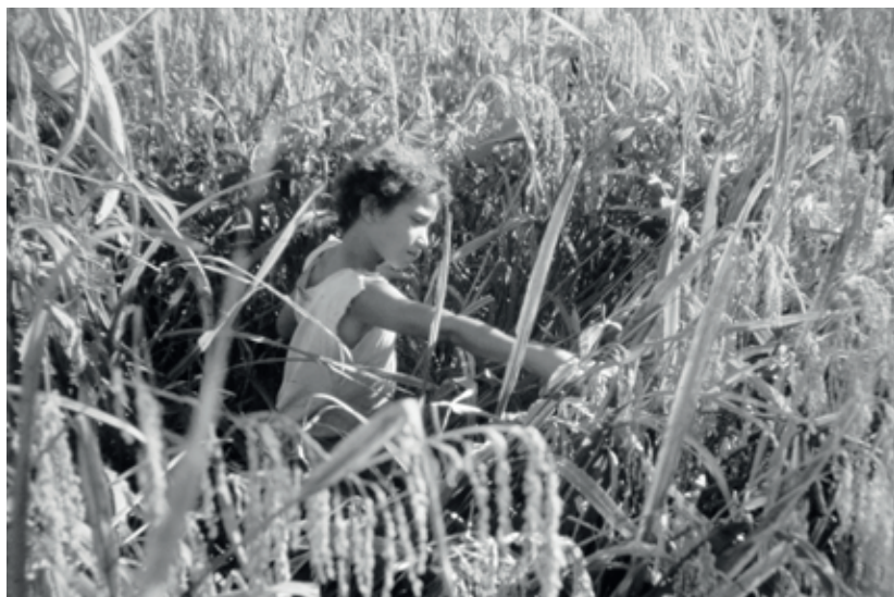
Colheita de arroz no Centro do Bala