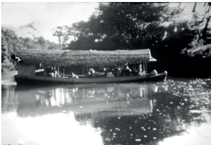
Embarcação típica do Rio Caru