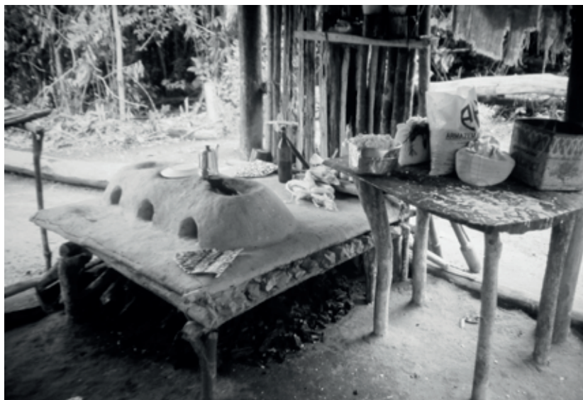
Detalhes da cozinha, no tijupá utilizado para moradia, no centro da floresta