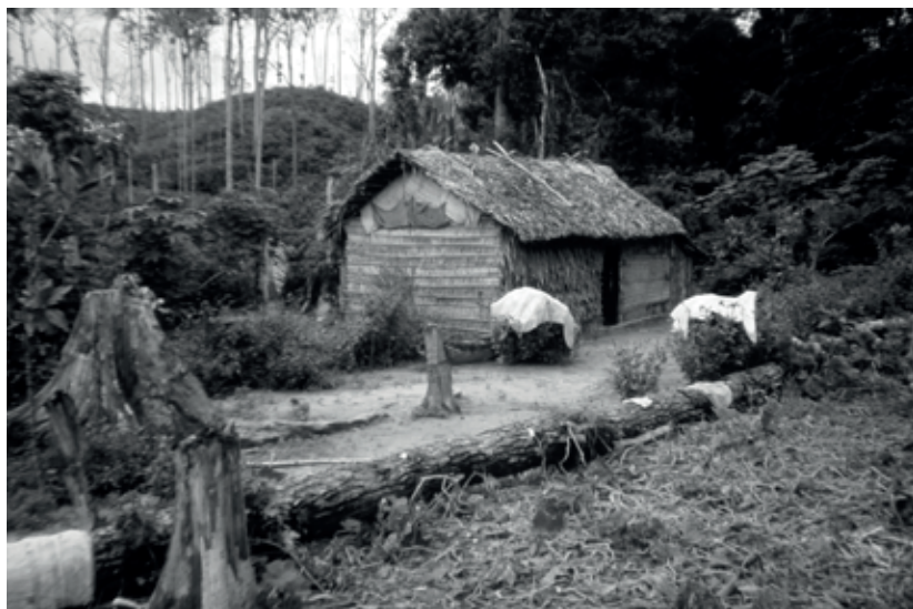
Vista de uma moradia no interior da floresta