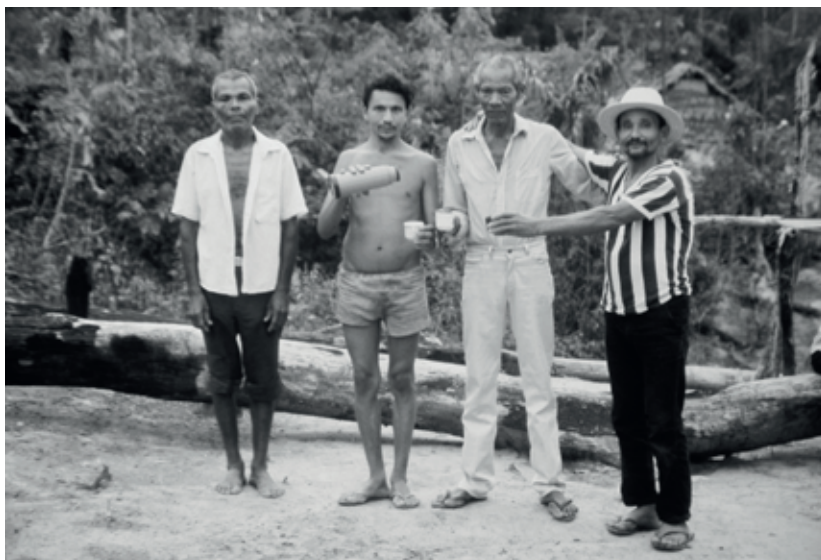
Confraternização entre assituantes e moradores de Centos