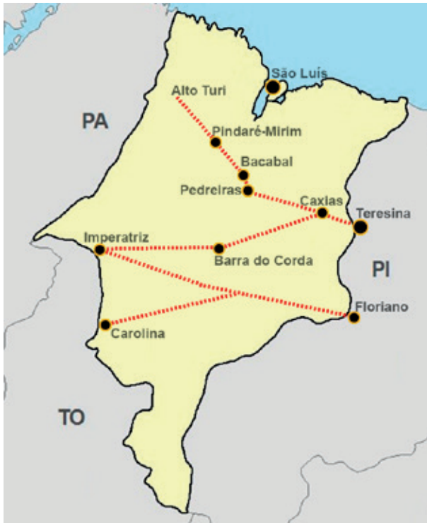
Caminhos de penetração dos nordestinos segundo Manoel correia de Andrade

sentam uma incompreensão, que apaga a riqueza e a diversidade de situações, além de significar, apenas, uma explicação convencional. Uma análise deste tipo, ainda, não atenta para o fato de que os movimentos de décadas anteriores estão ligados às secas e aos planejamentos governamentais de colonização, ao contrário deste ramo que ocupa o Caru e o Turizinho.