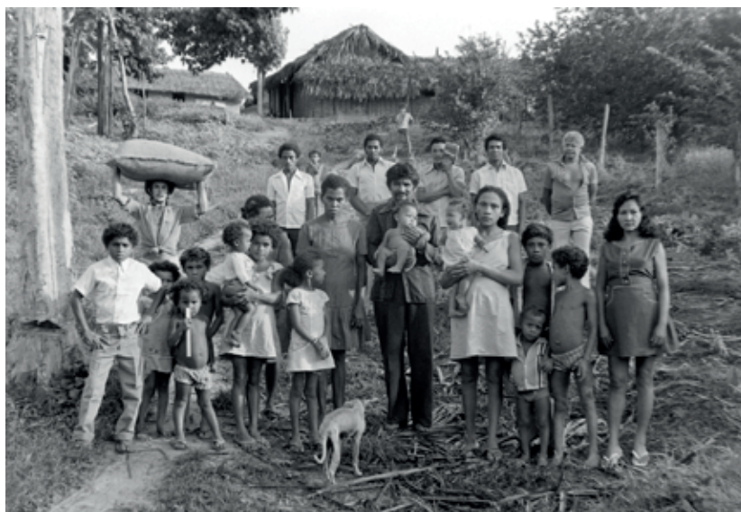
Moradores do último povoado na cabeça da frente - Conceição do Caru