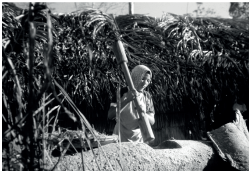
Pilão escavado no tronco de uma árvore