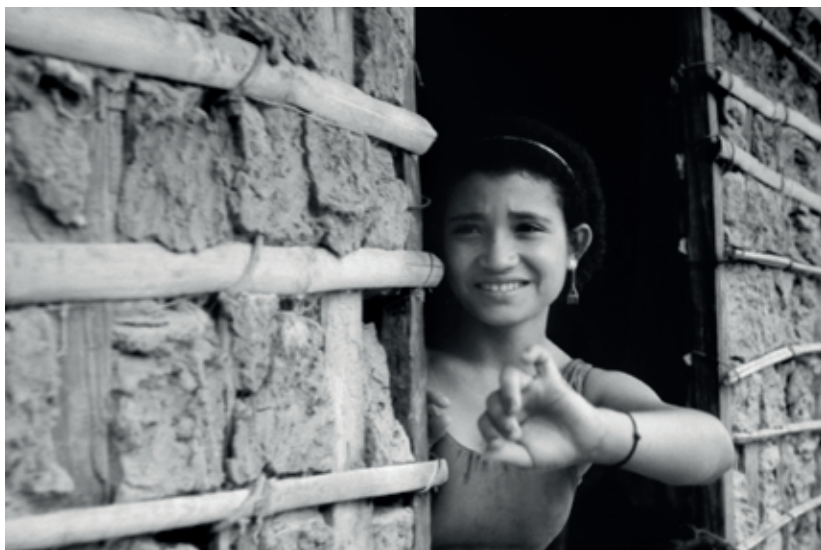
Centro dos Bala. Pedra, filha do assituante