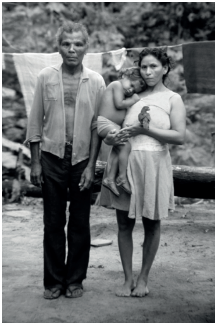
Moradores de centro vizinho Centro de Roberto