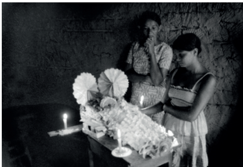
Funeral de anjinbo