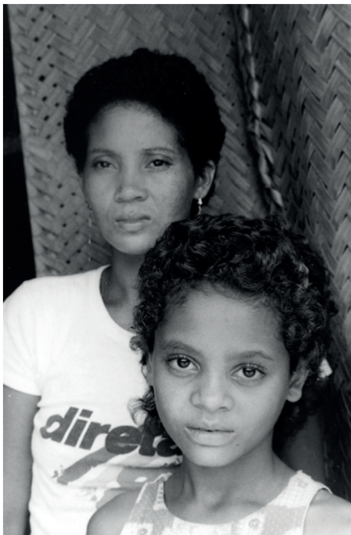
Mãe e filha, moradoras do Centro do Roberto