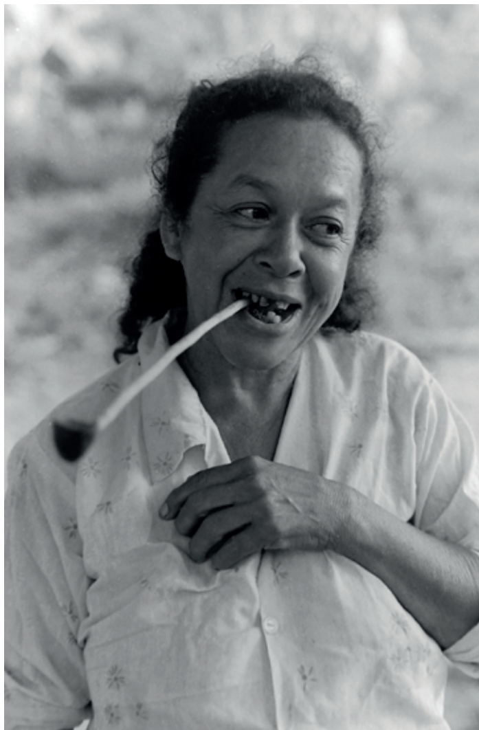
Moradora de Conceição do Caru